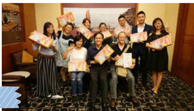
第2屆第2次 理監事會議