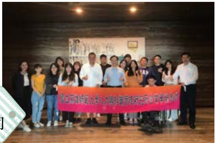
展悅建設 股份有限公司