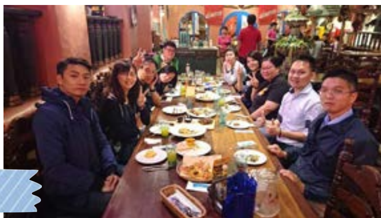
第2屆第4次 理監事會議