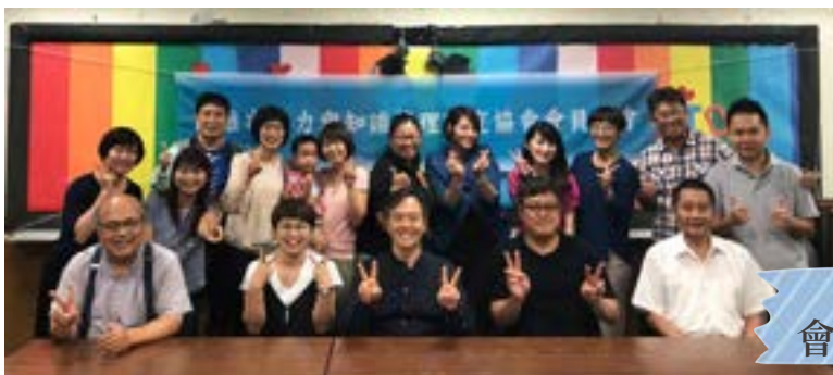
第2屆第1次 會員大會與理監事會議