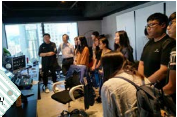
Pchome 網路商店製作過程