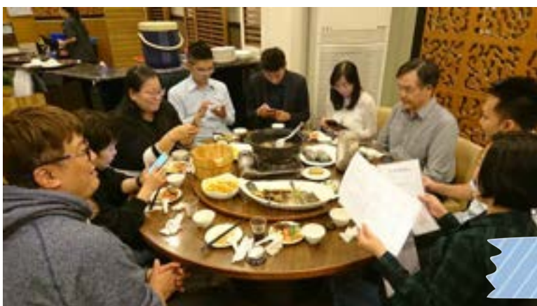
第2屆第3次 理監事會議