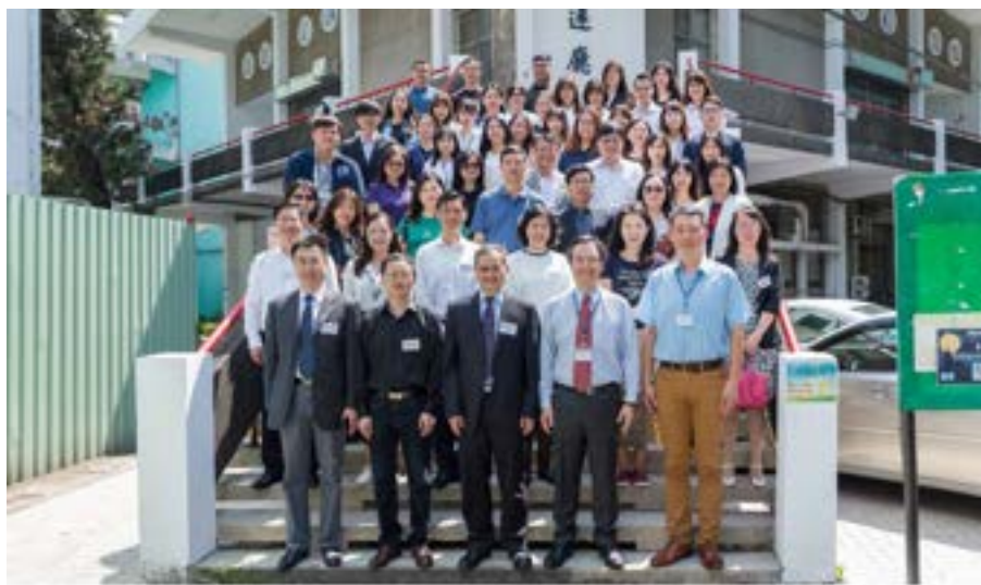
2019領導人才論壇暨中華人力資源研究會年會台灣研討會 2019年4月30日