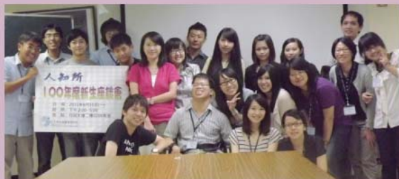
第一次的親密接觸，日間部100年度新生座談會 攝於2011.8.5