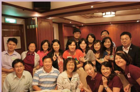
100級碩士在職專班迎新合影 攝於2011.9.2