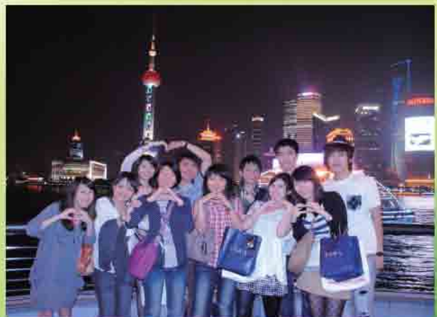
第五屆大陸參訪團成員於上海外灘合影 攝於2011.5.6

一群人浩浩蕩蕩地回到了美麗的家鄉，但在我心裡並不是只有我們回來，在我心中有著滿滿的美麗回憶，更有那些在內地招待我們的朋友們，給我滿滿的感激與懷念。■