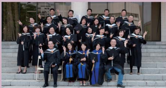
97級碩士在職專班畢業生 攝於2011.6.3